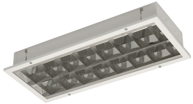
Специсполнение P19 с зеркальной решеткой

Светодиодный светильник встроенного монтажа предназначен для установки в зашивные потолки различных судовых помещений.