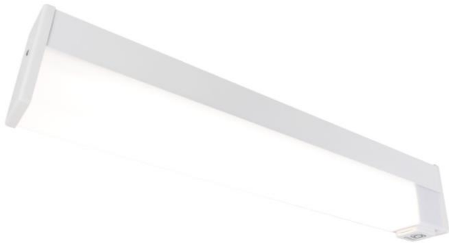
Серия K27 LED

Светильник призеркальный светодиодный для морских судов