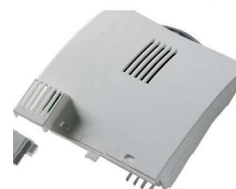
Блок терморегулятора. Вид сзади

Судовые обогреватели эргономичного дизайна для установки в жилых помещениях. Корпус обогревателя выполнен из листовой стали, окрашенной в белый цвет, порошковой термостойкой краской.