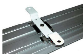
Кронштейн AC с планкой