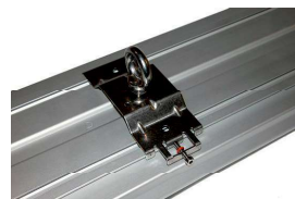
Кронштейн AC с рым-болтом

Инновационный, водозащищенный, светодиодный светильник для освещения открытой палубы морских судов различного назначения.