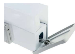
Легкое обслуживание (подпружиненные заглушки)