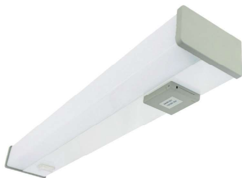
Серия TL14 LED