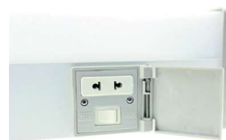
Розетка с разделительным трансформатором