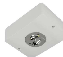
E85-S, накладной монтаж

Светодиодный указатель эвакуационных путей и обозначения аварийных выходов для накладного потолочного или настенного монтажа на морских судах.