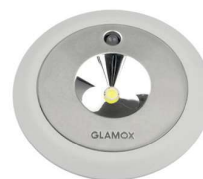
E85-R WB, круглый, встроенный монтаж