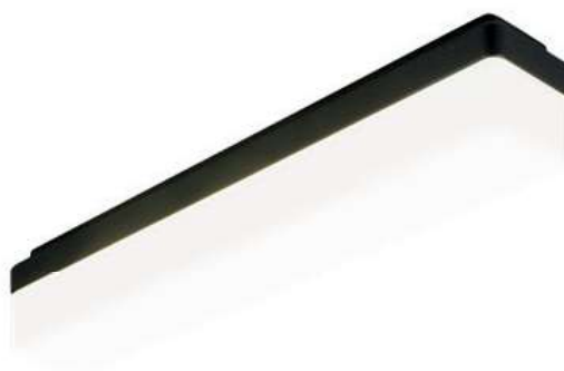
Корпус черного цвета

Современный светодиодный светильник настенного или потолочного монтажа для освещения технических и жилых помещений на морских судах.