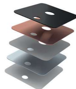
Сменные лицевые панели

Прикроватный светодиодный светильник с гибким кронштейном для местного освещения в каютах морских судов.