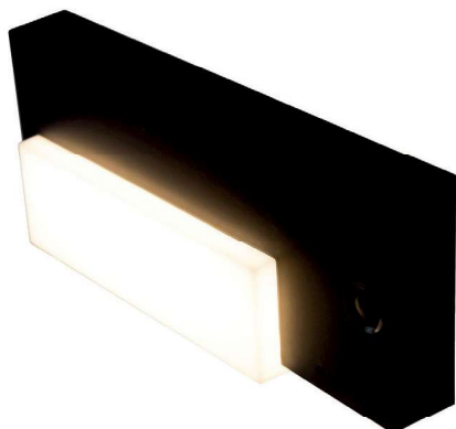
Серия AL42 LED