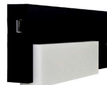
AL42 с портом USB-зарядки