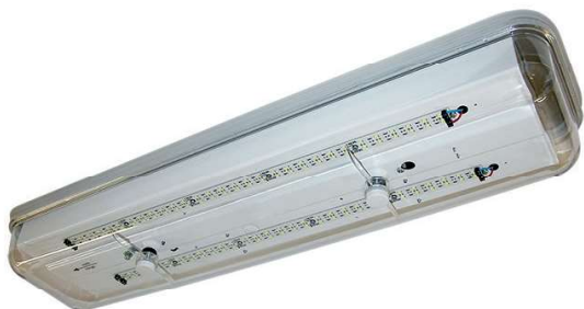
Серия 1961 LED